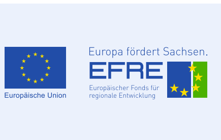
Abbildung der EU-/EFRE-Logokombination

Bei allen Informations- und Kommunikationsmaßnahmen – also bei sämtlichen Publikationen, Pressemitteilungen, Internetpräsentationen, social-media-Auftritten etc. – müssen Sie als Begünstigter der EFRE-Förderung die EU-/EFRE-Logokombination an einer deutlich sichtbaren Stelle abbilden. Platzierung und Größe stehen im Verhältnis zur Größe des betreffenden Materials.